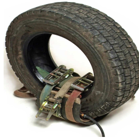
Kit camión peq. hasta par- che nº140 ref V1