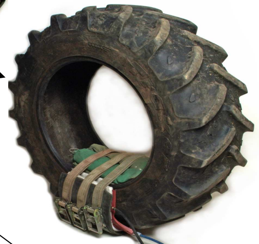
Kit agricola ,adjutable a ref V2 y hasta el parche 186 Réf V3