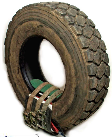
Kit ING. CIVIL hasta el parche 150 adjutable a V2 réf V82

PANEL CONTROL ref STR978 - 220V 16A, monofase 2 minuterios 0-12 horas. Cajetin disyuntor 16 A 30 mA, amperimetro 20 A en fachada. 4 salidas de aire atenuadas por 2 reguladores. Reguladores ajustables. Aire 2 bars maximo ajuste fabrica.4 Salidas de aire y 4 salidas electricas.Regulación con lectura de temperatura real y solicitada. 10 A por salida y 16 A en total. 4 extensiones de aire y 4 extensiones electricas largo:4 m Posibilidad de conectar 4 mantas al mismo tiempo, por lo tanto 2 neumaticos en cocción a la vez.